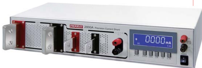
校驗室電流標準器 測量電流從1uA到2000A