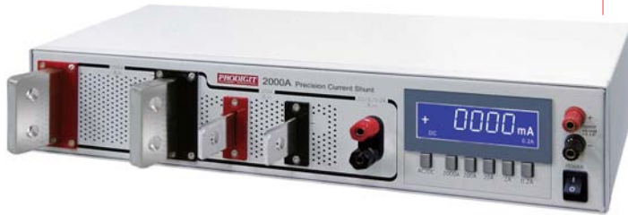
校驗室電流標準器 測量電流從1uA到2000A